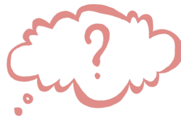
Chwila na refleksję

Materiały dodatkowe oznaczone są następującymi ikonkami: